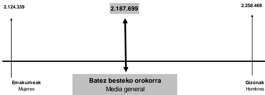
GRÁFICO 2.9. GRAFIKOA Batez besteko oinarri ezargarria sexuaren arabera Base imponible media según sexo

La cuota líquida media de los hombres ascendió a 7.521 euros y es superior en un 4,3% a la de las mujeres (7.208 euros).