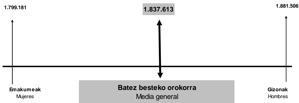
GRÁFICO 2.8. GRAFIKOA Batez besteko oinarri ezargarria sexuaren arabera Base imponible media según sexo

La cuota líquida media de los hombres ascendió a 9.141 euros y es superior en un 11,5% a la de las mujeres (8.200 euros).