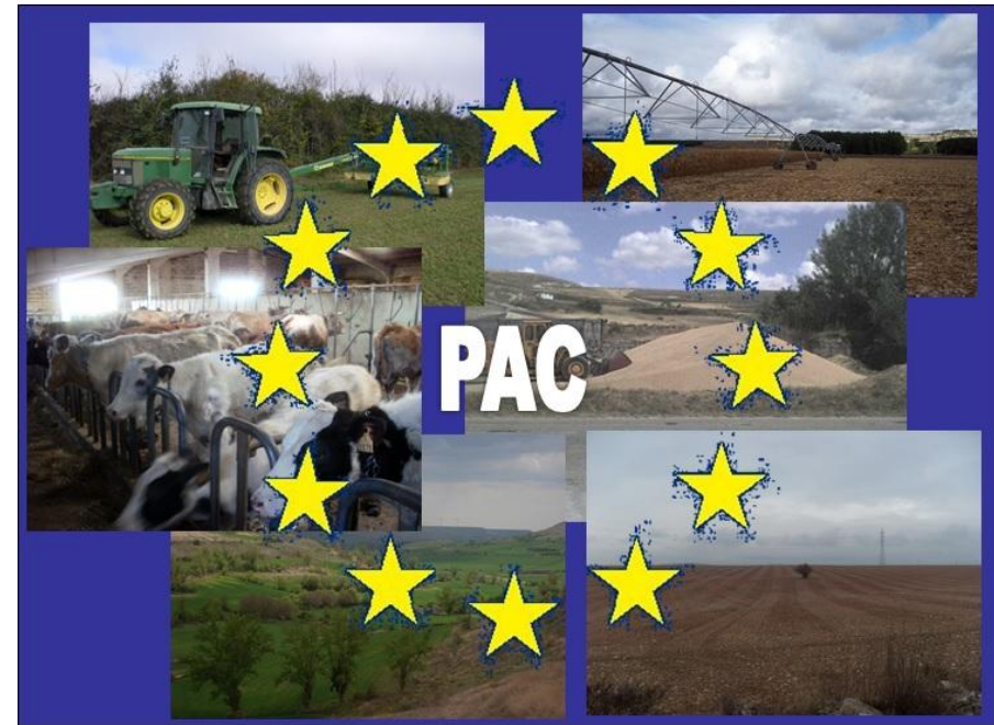
Nekazaritza Politika Bateratua