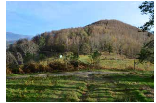
8. En el cruce, tomar a la izquierda