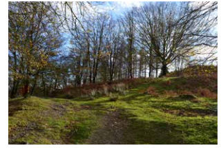
6. Seguir adelante