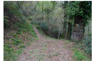
10. Tomar el camino de la izquierda