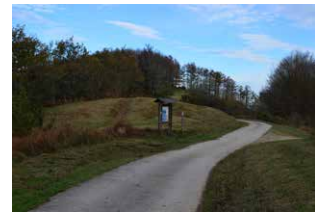
9. Tomar camino a la izquierda