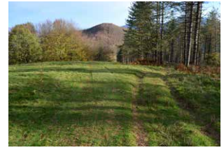
7. Ezkerrerko bidea hartu, suebakitik doana

ezkerretan, laritz birpopulaketa itxi-itxiak izango ditugu, eta eskuinetan, berriz, Douglas izeia, baita ehizarako postu ugari ere.