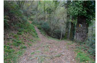
10. Ezkerreko bidea hartu