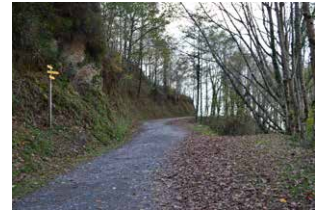
2. Segi aurrera, eskuineko bidea saihestuz