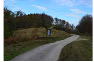
9. Ezkerreko bidea hartu