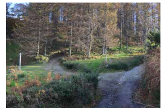
5. Ezkerreko bidea hartu eta ondoren erdikoa, mendian gora

pinudiaren tokian irtendako belardiaren gainean tipi-tapa oinez, isurialdeen banalerroari jarraituko diogu pagadiaren ertzetik barrena. Igelak eta halako beste hainbat anfibio ugaltzeko naturalizatutako bi putzu artifizialen parean, Otsarte muinotik igarotzen