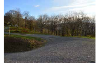
3. Ezkerreko bidea hartu