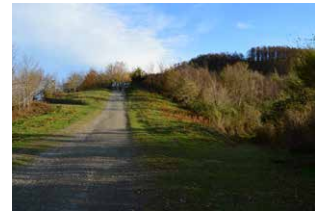
4. Segi aurrera, ezker-eskuin agertzen diren bideak saihestuz