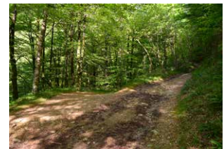
11. Aurrera, ezkerreko bidea hartu gabe