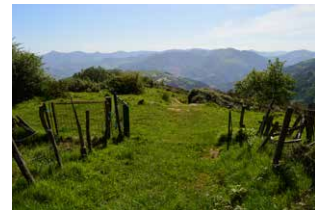
19. Langa pasa eta zuzen