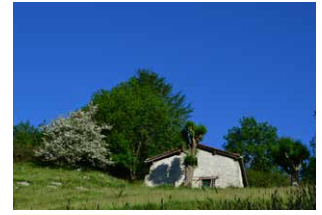
7. Belardirako sarrera. Aurrera jarrai