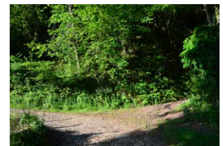
6. Ezkerreko bidea