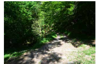
10. Aurrera, ezkerreko bidea hartu gabe