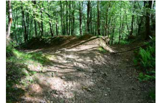
17. Gomendagarria, ezkerreko bidea, sigi-saga