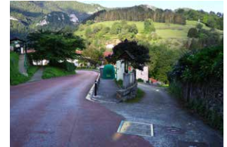
2. Eskuineko aldapan behera