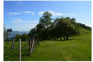
16. Ezkerrera, beherantz