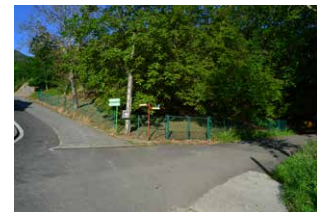
4. Eskuineko bidea