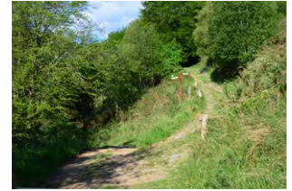
8. Ezkerreko bidea