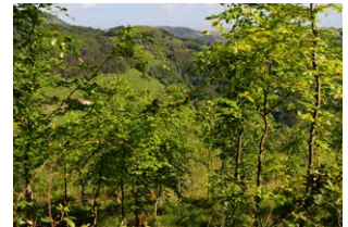
18. Pago saila