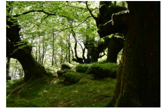
12. Mugarrotutako pagadia