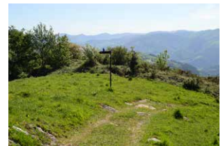
20. Eskuinerantz, behera