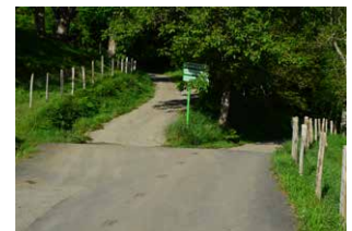
5. Ezkerreko bidea