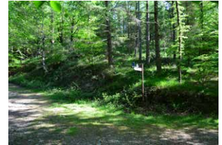
13. Segi bidea, ezker aldera