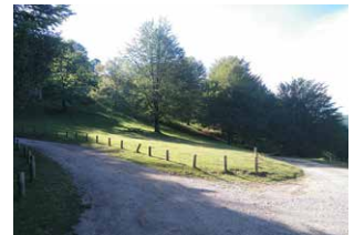
2. Dejaremos el camino de grava y nos adentraremos en el herbazal, hacia donde está el roble