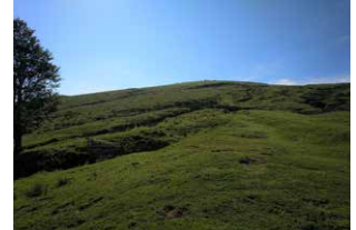
6. Final del hayedo