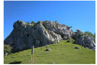
8. Majada de Garagartza