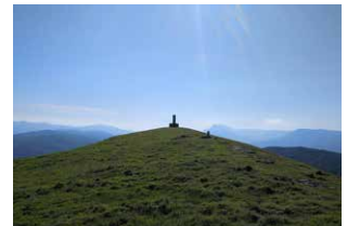
7. Cima de Txurruko Punta