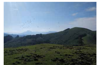
3. La cima del monte Unamuno