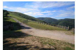
4. Cruce de caminos, tomar el camino de la izquierda, hacia el sureste.