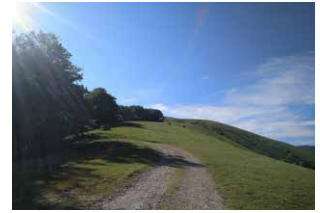
5. Dejar la pista de grava para internarse en el prado, cuesta arriba