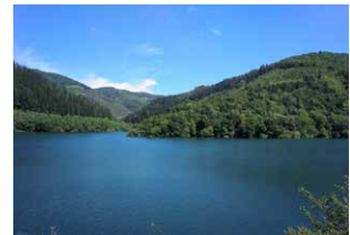
2. Vista del embalse