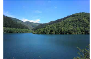
2. Urtegiaren ikuspegia