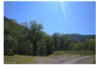
7. Pista nagusitik segi, ezkerreko bidea saihestuz