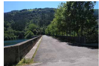
8. Presaren ertza