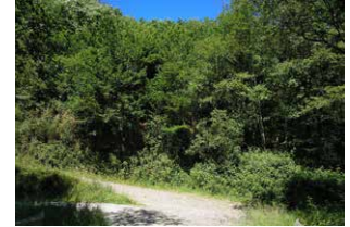
6. Jarrai bideari, eskuinekoa saihestuz