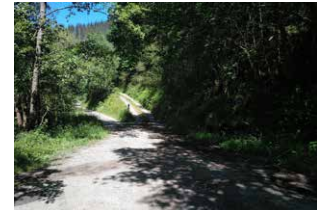
5. Iturriaren ondoren, ezkerretik segi