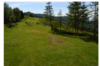
6. Bidegurutzean, aurrera

O rain 5000 eta 3000 urte inguru, artean ehizan eta bilketan jarduten zuten artzain tradizioko erkidegoek altxatuak dira trikuharriak edo jentil harriak (hots, jentilen harriak, hilarriak). Oro har, trazu angeluzuzeneko ehorzketa ganbera bat izaten dute, bloke handiz estalita, zeina, aldi berean, osorik babesturik ageri baitzen, oinplano zirkularreko harri eta lur metaketa ordenatu edo tumulu batez.