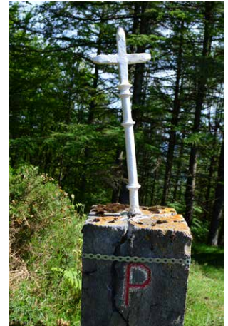
13. Pagobedeinkatuko mugarrria, bidetik aparte, ezkerrean