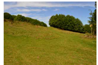
23. Eskuinera, hasierako bidetik