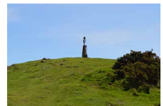
19. Irukurutzetako mugarria