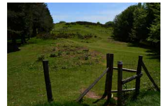
17. Atakaren ondoren, aurrera