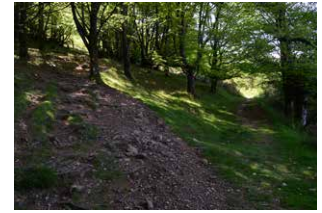
15. Bidegurutzean, ezkerretik