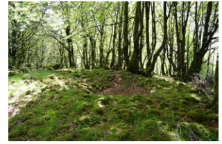
12. Pago txaradia, Aizkoingo trikuharriaren inguruan