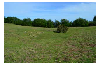
9. Idoiagako laua