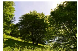
11. Pago angioa (dehesa)