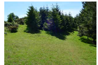
10. Bidegurutzean, eskuinera