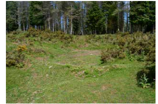
21. Urmaela edo putzua