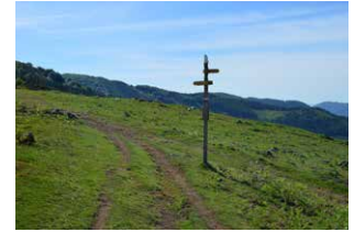
8. Bidegurutzean, aurrera