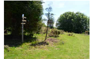
16. Seinalearen ondoren, ezkerrean