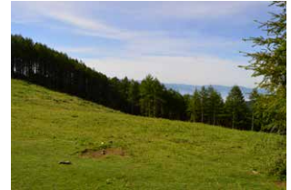
4. Izeiak atzean utzi eta landara