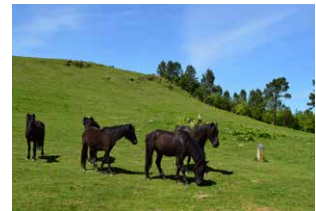
8. Metalezko langa, pistan jarrai