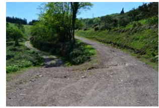
5. Bidegurutzean, aurrera