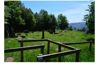
9. Mulisko multzo megalitiko