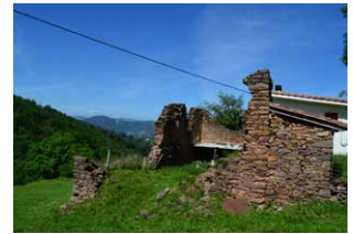
3. Pozontarri baserria