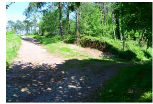
7. Bidegurutzean, ezkererra