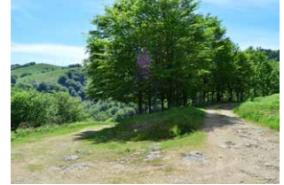
9. En el cruce, a la derecha