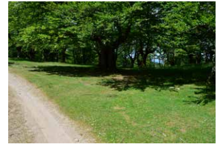
10. En el cruce, a la derecha, dejando la pista