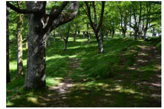
5. En el cruce, a la izquierda. A la vuelta, a la derecha