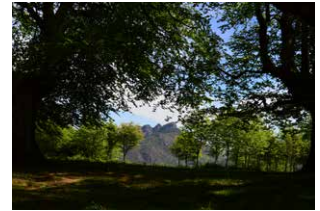
6. Hayedo trasmochera