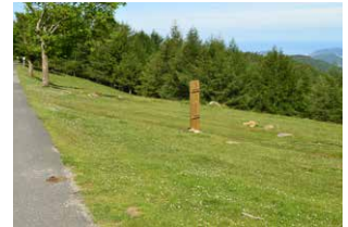
2. Seinalea duen bidea hartu