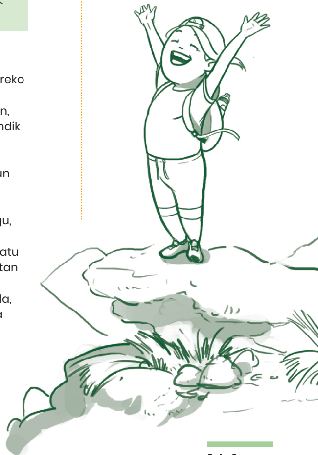
4. Pistan jarrai