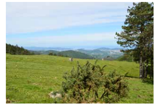
3. Larrean, pistan jarrai