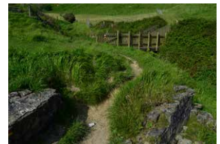
9. Zubiaren aurretik, ezkerreara