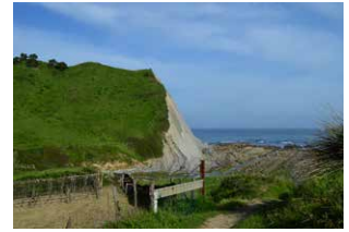
7. Marearteko zabalgunea