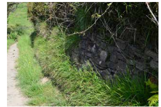
6. Harrizko horma bide ertzean

tsas paraje honetan, fenomeno berezi baten gainean ageri dira Sakonetako muturreko itsaslabarrak: «marearteko zabalgunea» edo «urradura plataforma», milaka eta milaka urtean zizelkatua, mundu zabalean ezaquna den Euskal Kostaldeko Geoparkeko flyschan. Flysch terminoak estratu bigunen (tuparri eta arroka buztintsuak) eta gogorren (kareharriak eta hareharriak) alternantzia erritmikoa ageri duen edozer sedimentu sekuentziari egiten dio erreferentzia. Ehunka milioi urtean, aro kretazikoan zehar -orain 145 eta 65 milioi urte-, egun Euskal Herriak okupatzen duen itsas ohean, sedimentuak geruza horizontaletan metatzen joan ziren. Orain 50 milioi urte inguru, plaka tektoniko iberiar eta europarren arteko talkaren ondorioz, estratu horiek irten ziren, egun ikusten ditugun itsaslabarrak eratuz. Geruza horiek Lurraren historia geografikoari buruzko datuak ematen dituzte, hala nola dinosauoak desagertu zirenekoa, krisi biologikoak eta ingurumenean eta kliman izandako aldaketak. Kala honetan disgregatutako estratu eta blokeetan, ohikoa da itsas ornogabeen hainbat aztarna edo pista fosil agertzea.