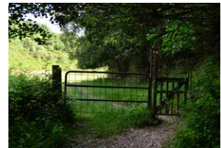
3. Belardia, ibaiaren meandroan