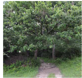
2. Baso misto atlantiarra