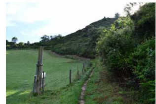
4. Bidegurutzea. Eskuineko bidea hartu