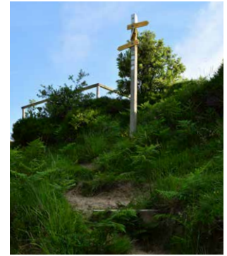
5. Begiralekua eskuinean. Ondoren, lehengo bidean aurrera