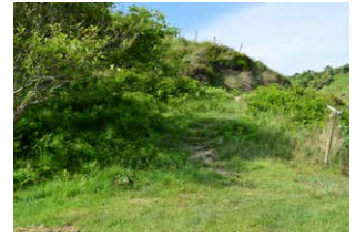
10. Goiko bidea hartu, ezkerarantz