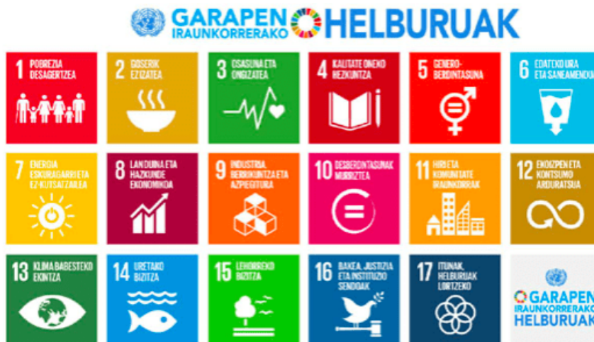
2023 Agenda: Garapen Iraunkorreko Helburuak (GJH), gaien arabera.

Une oro kontuan hartuko dira garapen iraunkorraren helburuak eta xedeak, eta, horretarako, kontuan hartuko dira Estatuko eta EAEko hiri-agendak, bai eta abian jartzen diren tokiko hiri-agendak ere.