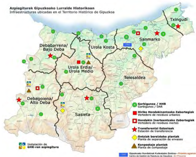
Figura 1. Infraestructuras GHK

Con el objeto de conocer la composición de la fracción resto de los residuos urbanos del Territorio Histórico de Gipuzkoa, se ha desarrollado una metodología específica de selección de áreas de muestreo, las cuales han permitido proporcionar datos representativos de todo el Territorio para la caracterización del residuos urbano. Derivada de la aplicación de dicha metodología se ha establecido un plan de muestreo que ha comprendido la caracterización de muestras de residuos urbanos (contenedor resto), repartidas a lo largo de las ocho mancomunidades que componen la gestión de los Residuos Urbanos en el Territorio Histórico de Gipuzkoa. El alcance del presente proyecto es la presentación de los resultados de los trabajos de caracterización, así como la de exponer la composición media de los residuos urbanos generados en Gipuzkoa.