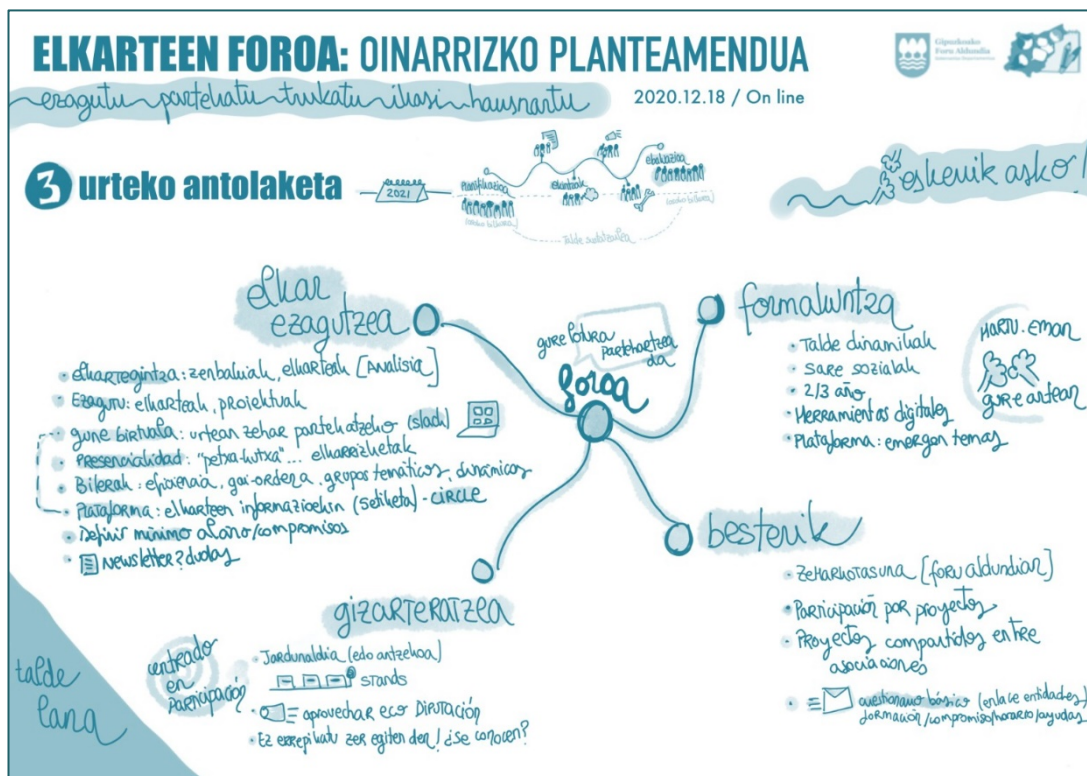
Gipuzkoako Elkarteen Foroaren oinarrizko planteamenduaren irudikapen grafikoa.

Elkarteen Foroaren lehenengo topaketa 2020ko abenduaren 18an egin zen. Bilera horretan, funtzionamendu eta plangintzarako lehenengo eskema marraztu zuten, Foroa martxan jarri ahal izateko.