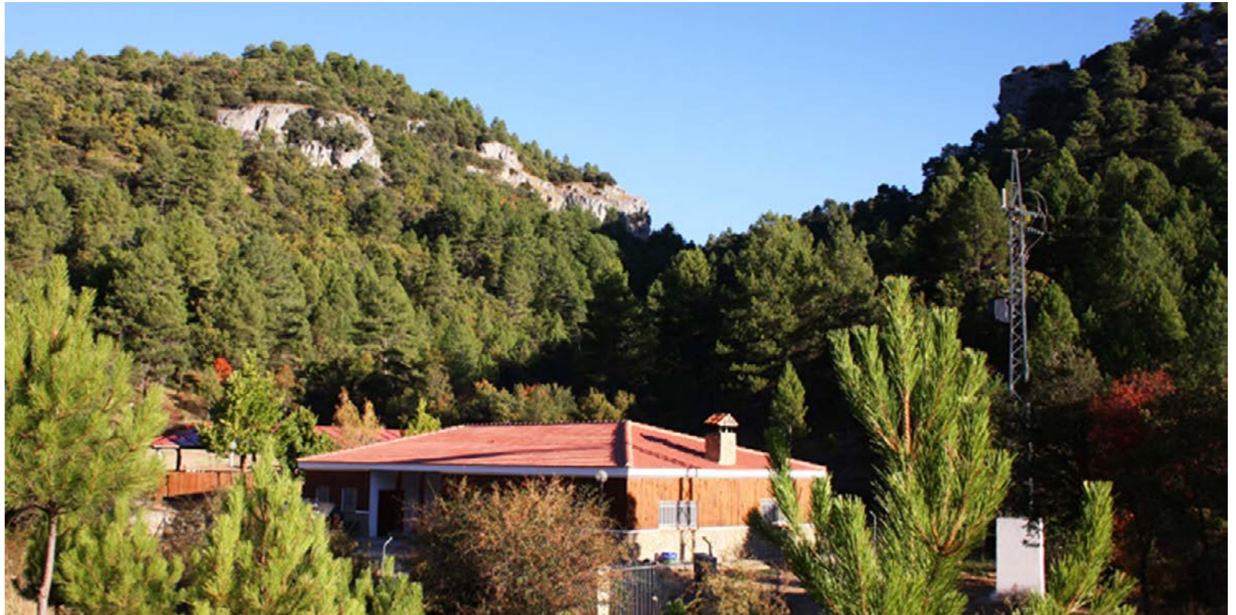
Vista panorámica del bosque en el que se encuentra el Campamento Alto Tajo