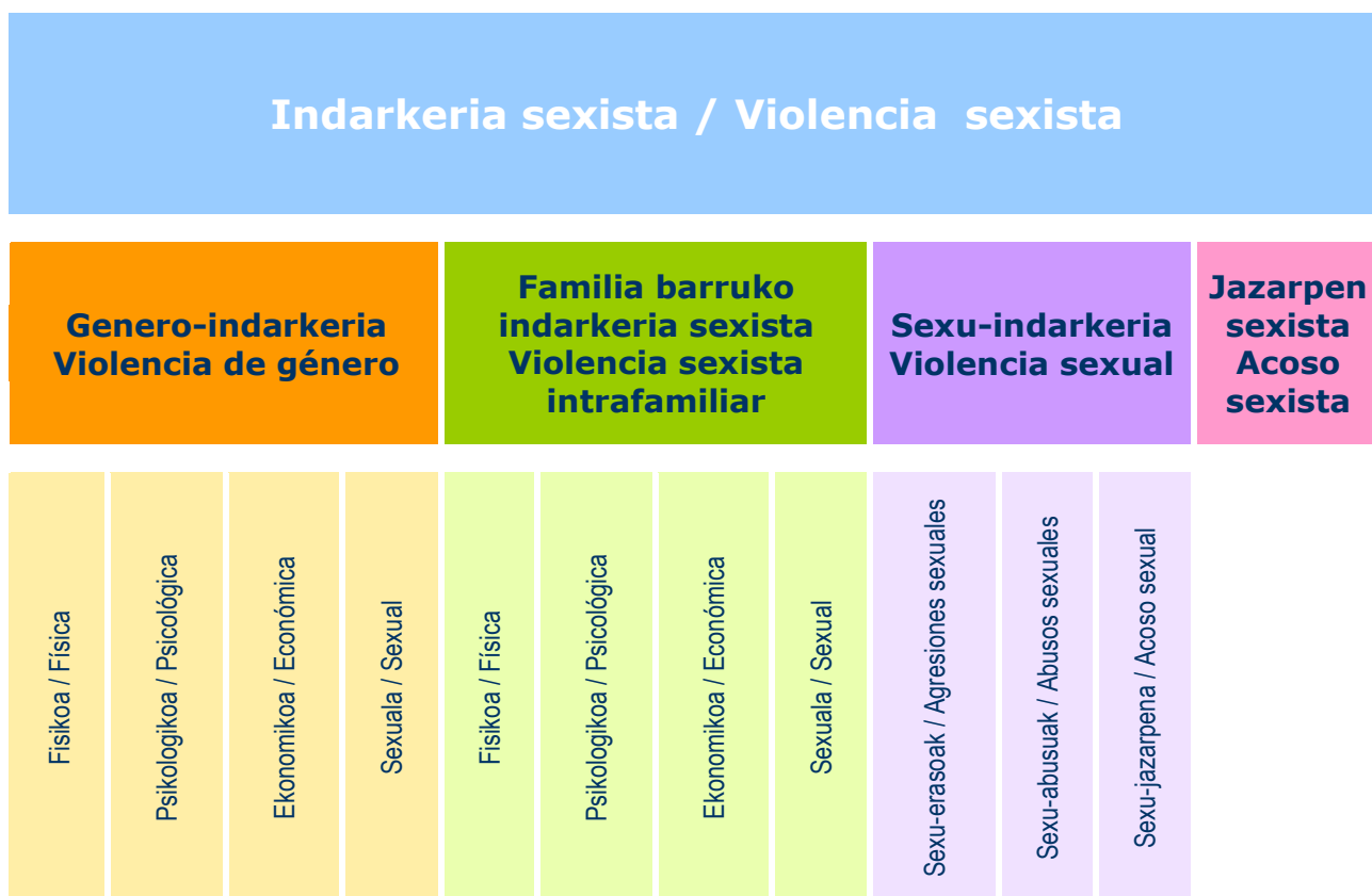
4. irudia: INDARKERIA SEXISTAREN MOLDEAK ETA ESPAZIOAK Figura 4: LAS FORMAS Y ESPACIOS DE LA VIOLENCIA SEXISTA

Esquematizando las distintas formas y espacios de la violencia sexista, tenemos el siguiente esquema: